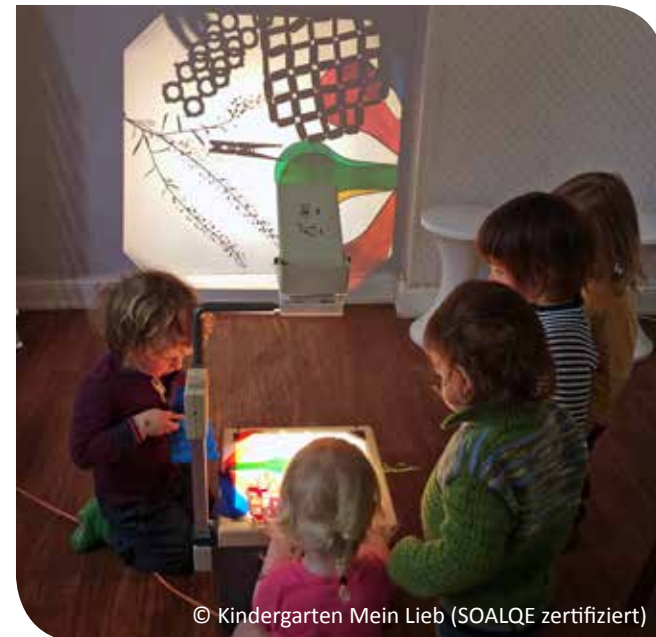
© Kindergarten Mein Lieb (SOALQE zertifiziert)